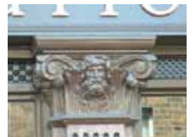
URDGZ.D. 0 DUNH&D/W DQGO XWRCB XE