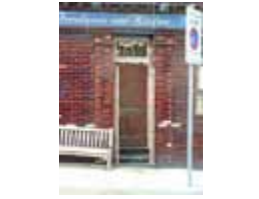
URDGZ.DA 0 DUNHW