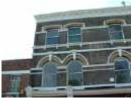
URDGZ.D. 0 DUN&VDW DQGO XWRCB XE