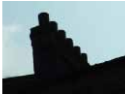
URDGZ.D. 0 DUNHW