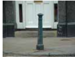
3 DY-P H00MUM-FVRCRI ' XCFDQ5 GDG%URDGZ D «