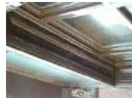
URDGZ.D. 0 DUN&VDW DQGO XWRCB XE