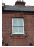
URDGZ.DA 0 DUNHW