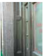
URDGZ.D. 0 DUN&VDW DQGO XWRCB XE