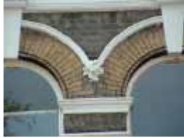
URDGZ.D. 0 DUN&VDW DQGO XWRCB XE