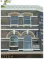
URDGZ.D. 0 DUN&VDW DQGO XWRCB XE