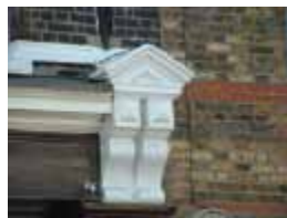
URDGZ.D. 0 DUNH&D/W DQGO XWRCB XE