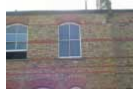
URDGZ.D. 0 DUNHW