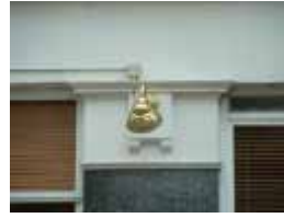
URDGZ.DA 0 DUNHW