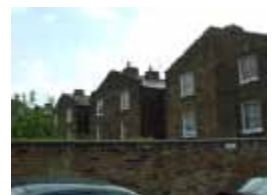
& URVRC6KRXVH/VHQ IURP VHEDFNRQZ UHGZH «