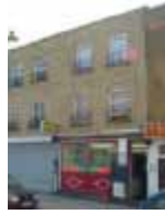
URDGZ.D. 0 DUNHW