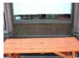
URDGZ.D. 0 DUNH&D/W DQGO XWRCB XE