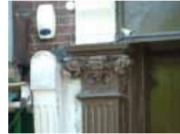
URDGZ.D. 0 DUN&VDW DQGO XWRCB XE