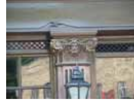
URDGZ.D. 0 DUN&VDW DQGO XWRCB XE