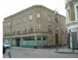
URDGZ.DA 0 DUNHW