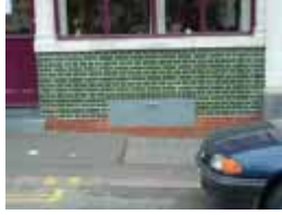
URDGZ.DA 0 DUNHW