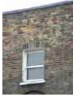
URDGZ.DA 0 DUNHW