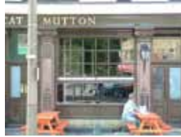
URDGZ.D. 0 DUN&VDW DQGO XWRCB XE