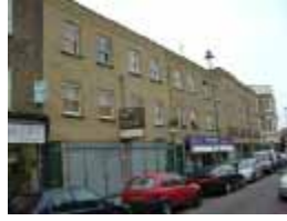
URDGZ.DA 0 DUNHW