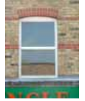
URDGZ.D. 0 DUNHW