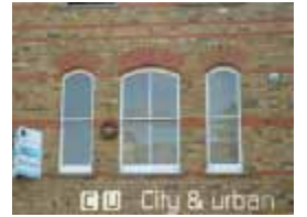
URDGZ.D. 0 DUNHW