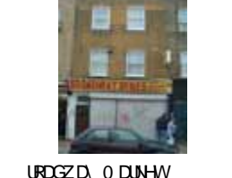
URDGZ.DA 0 DUNHW