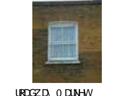
URDGZ.DA 0 DUNHW