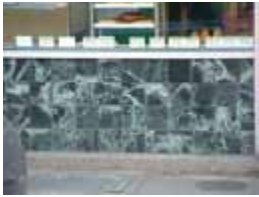
URDGZ.D. 0 DUNHW