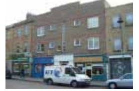
URDGZ.D. 0 DUNHW