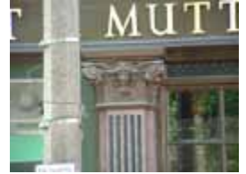
URDGZ.D. 0 DUN&VDW DQGO XWRCB XE