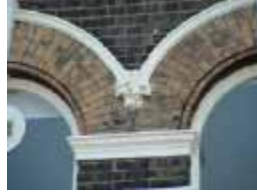
URDGZ.D. 0 DUN&VDW DQGO XWRCB XE