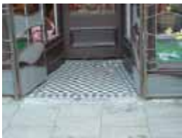
URDGZ.D. 0 DUNHW