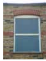
URDGZ.D. 0 DUNHW