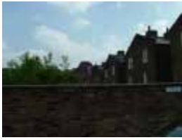
&URVRC6KRXVHVHQ IURP VHEFNRC7 UHGZH «