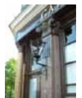
URDGZ.D. 0 DUNH&D/W DQGO XWRCB XE