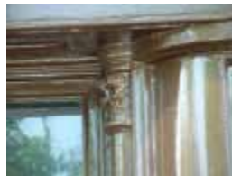
URDGZ.D. 0 DUN&VDW DQGO XWRCB XE