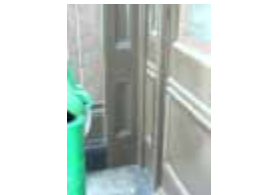
URDGZ.D. 0 DUN&VDW DQGO XWRCB XE