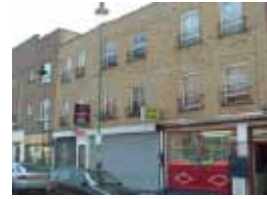
URDGZ.D. 0 DUNHW