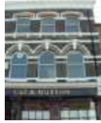
URDGZ.D. 0 DUN&VDW DQGO XWRCB XE