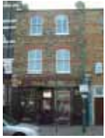
URDGZ.D. 0 DUNHW