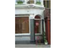
URDGZ.DA 0 DUNHW