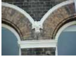
URDGZ.D. 0 DUN&VDW DQGO XWRCB XE