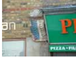
URDGZ.D. 0 DUNHW