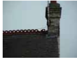
URDGZ.DA 0 DUNHW