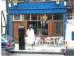
URDGZ.DA 0 DUNHW