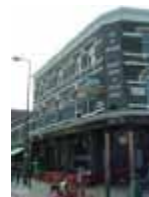
URDGZ.D. 0 DUNH&D/W DQGO XWRCB XE