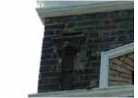
URDGZ.D. 0 DUN&VDW DQGO XWRCB XE