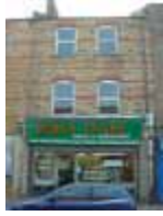
URDGZ.D. 0 DUNHW