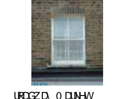
URDGZ.DA 0 DUNHW