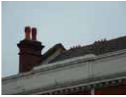
URDGZ.DA 0 DUNHW