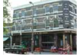
URDGZ.D. 0 DUN&VDW DQGO XWRCB XE