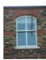
URDGZ.D. 0 DUNHW