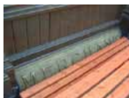
URDGZ.D. 0 DUNH&D/W DQGO XWRCB XE