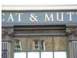
URDGZ.D. 0 DUNH&D/W DQGO XWRCB XE