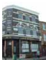
URDGZ.D. 0 DUNH&D/W DQGO XWRCB XE