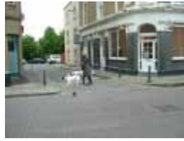
3 DY-P H00MUM-FVRCRI ' XCFDQ5 GDG%URDGZ D «