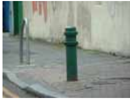
3 DY-P H00MUM-FVRCRI $ GD6D0G%URDGZ D 0 Dk