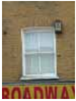
URDGZ.D. 0 DUNHW