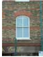
URDGZ.D. 0 DUNHW