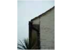
URDGZ.DA 0 DUNHW