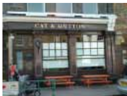
URDGZ.D. 0 DUNH&D/W DQGO XWRCB XE