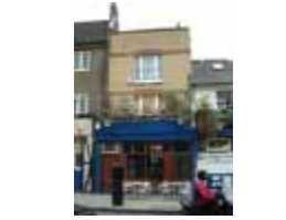
URDGZ.DA 0 DUNHW