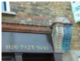
URDGZ.D. 0 DUNHW