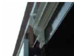
URDGZ.D. 0 DUN&VDW DQGO XWRCB XE