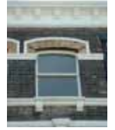
URDGZ.D. 0 DUN&VDW DQGO XWRCB XE