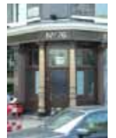
URDGZ.D. 0 DUNH&D/W DQGO XWRCB XE