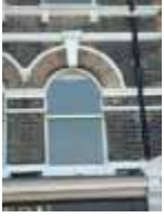
URDGZ.D. 0 DUN&VDW DQGO XWRCB XE