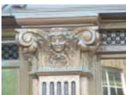
URDGZ.D. 0 DUNH&D/W DQGO XWRCB XE