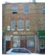
URDGZ.D. 0 DUNHW