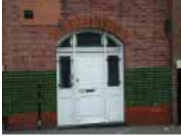
URDGZ.DA 0 DUNHW