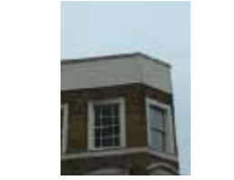
URDGZ.DA 0 DUNHW