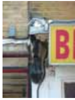
URDGZ.D. 0 DUNHW