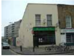
URDGZ.DA 0 DUNHW