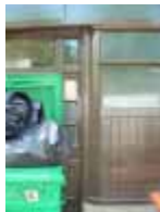
URDGZ.D. 0 DUN&VDW DQGO XWRCB XE