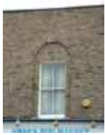
URDGZ.DA 0 DUNHW