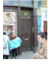
URDGZ.D. 0 DUNHW