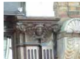
URDGZ.D. 0 DUNH&D/W DQGO XWRCB XE