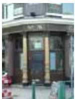
URDGZ.D. 0 DUNH&D/W DQGO XWRCB XE