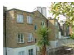
& URVRC6KRXVH/VHQ IURP VHEDFNRQZ UHGZH «